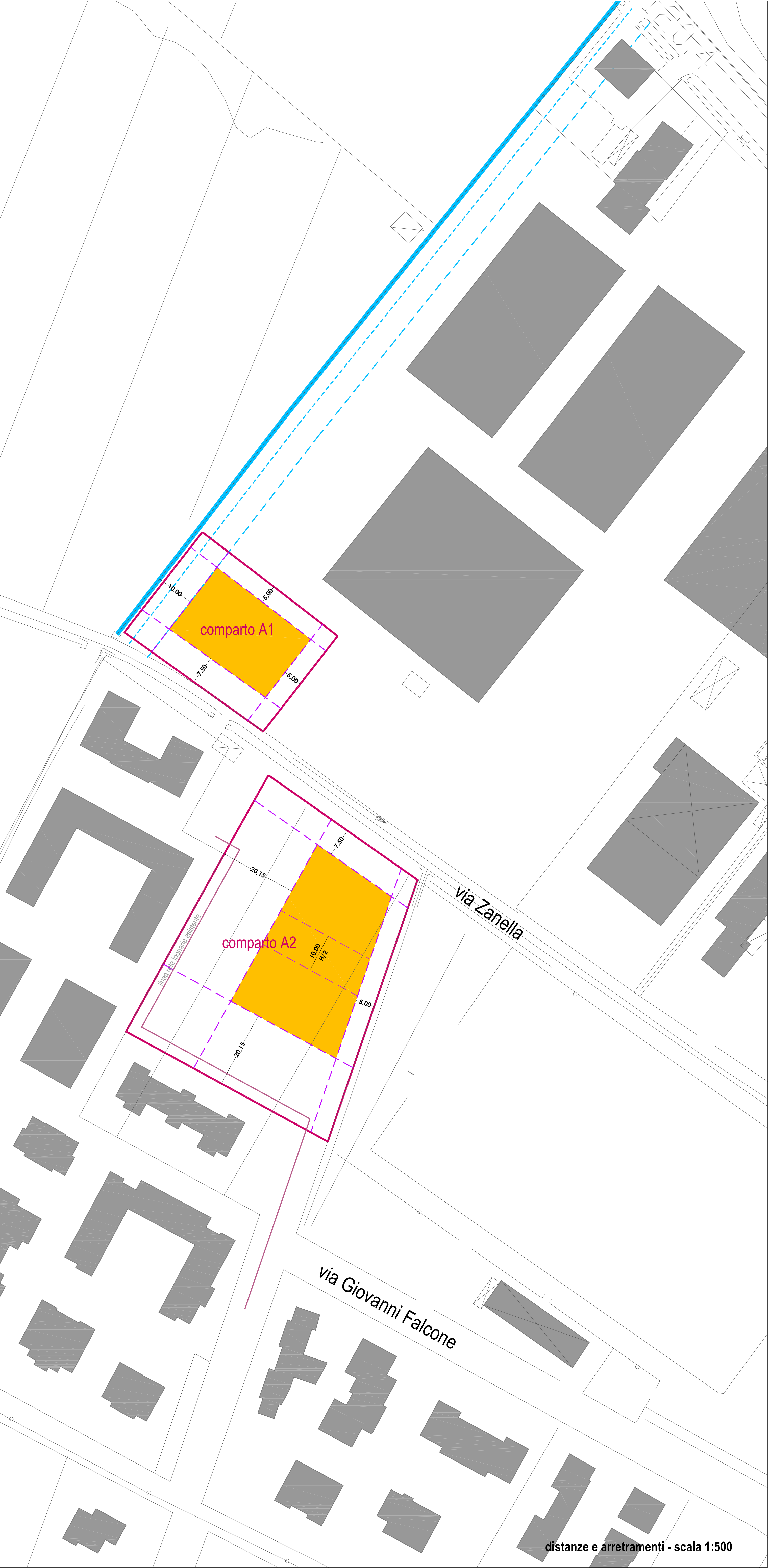
distanze e arretramenti - scala 1:500