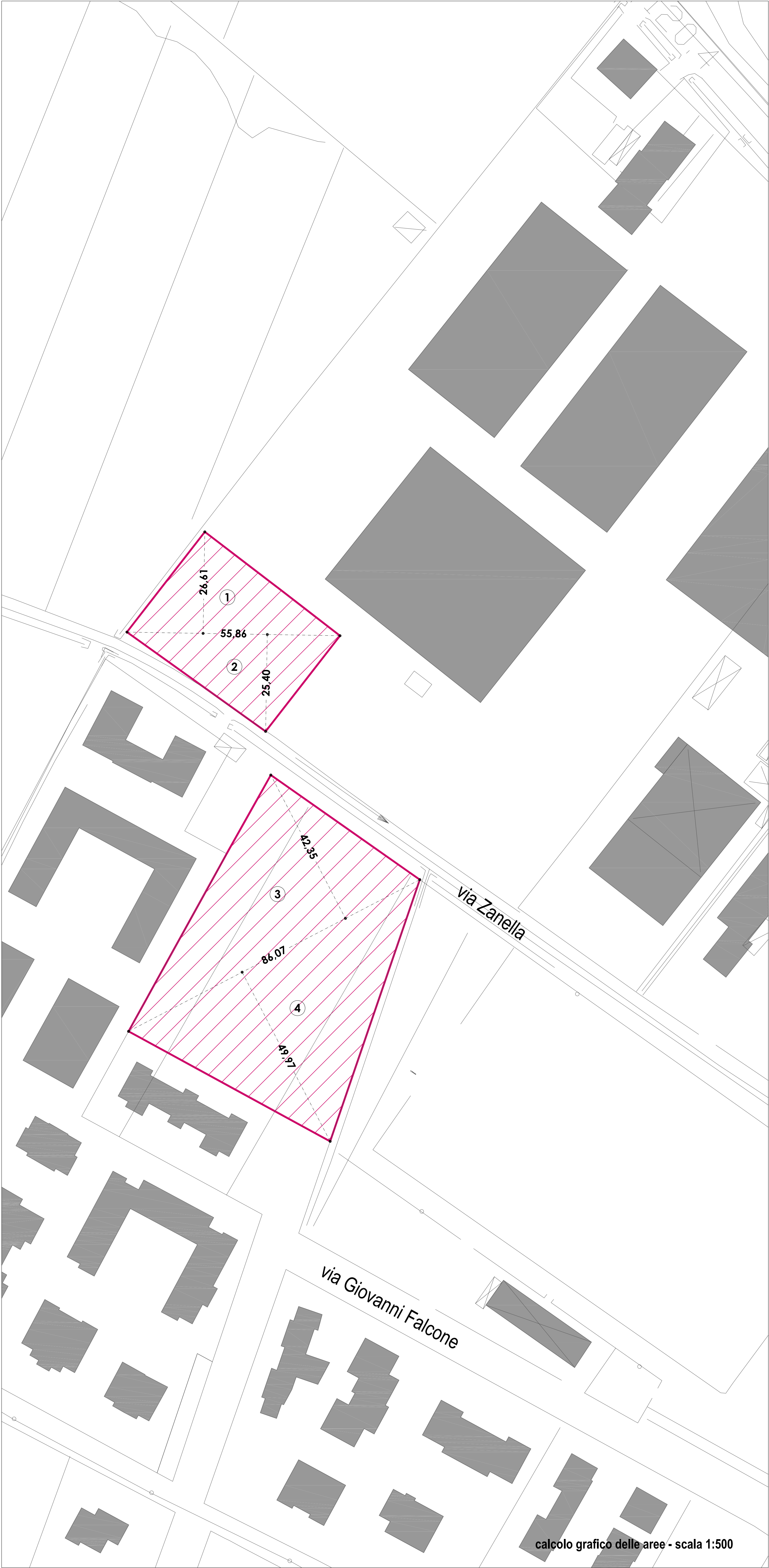
calcolo grafico delle aree - scala 1:500