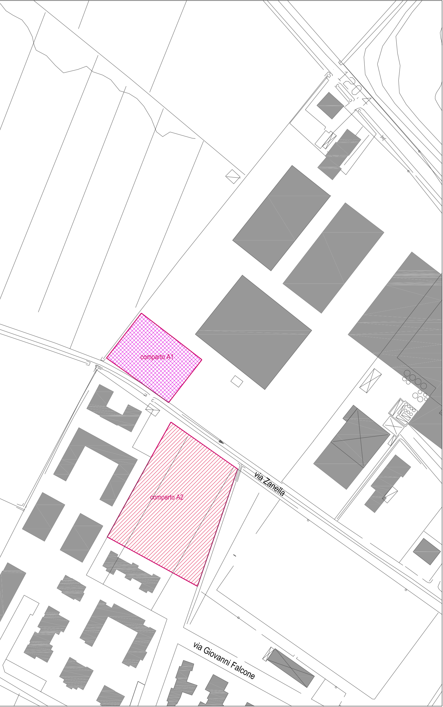
Destinazione urbanistica prevista nell'ambito del Programma Integrato di Intervento